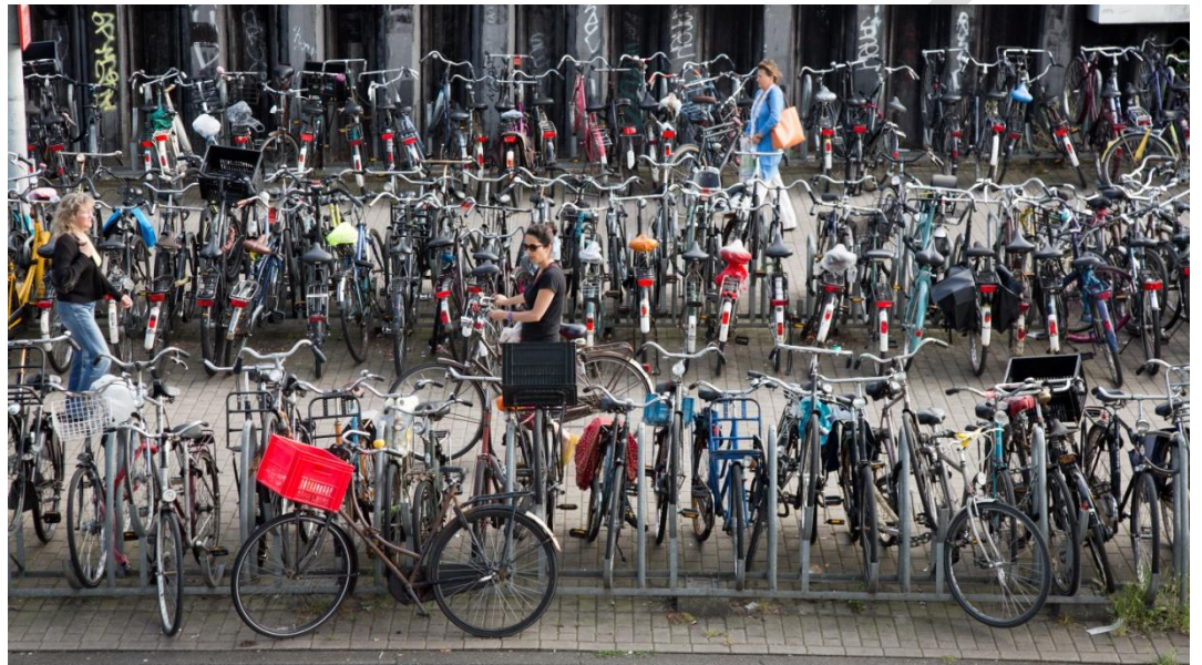
Fietsen Centraal Station

Stationseiland is grootstedelijk gebied. Het dagelijks beheer, zoals het schoon en heel houden, is in handen van het stadsdeel. Het gebied wordt in de toekomst overgedragen aan het stadsdeel. Als dit gebied is overgedragen zal het onderdeel gaan vormen van gebied 1011.